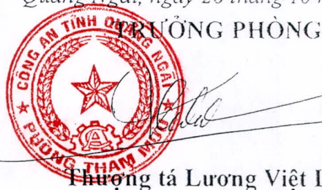
Thượng tá Lương Việt Long